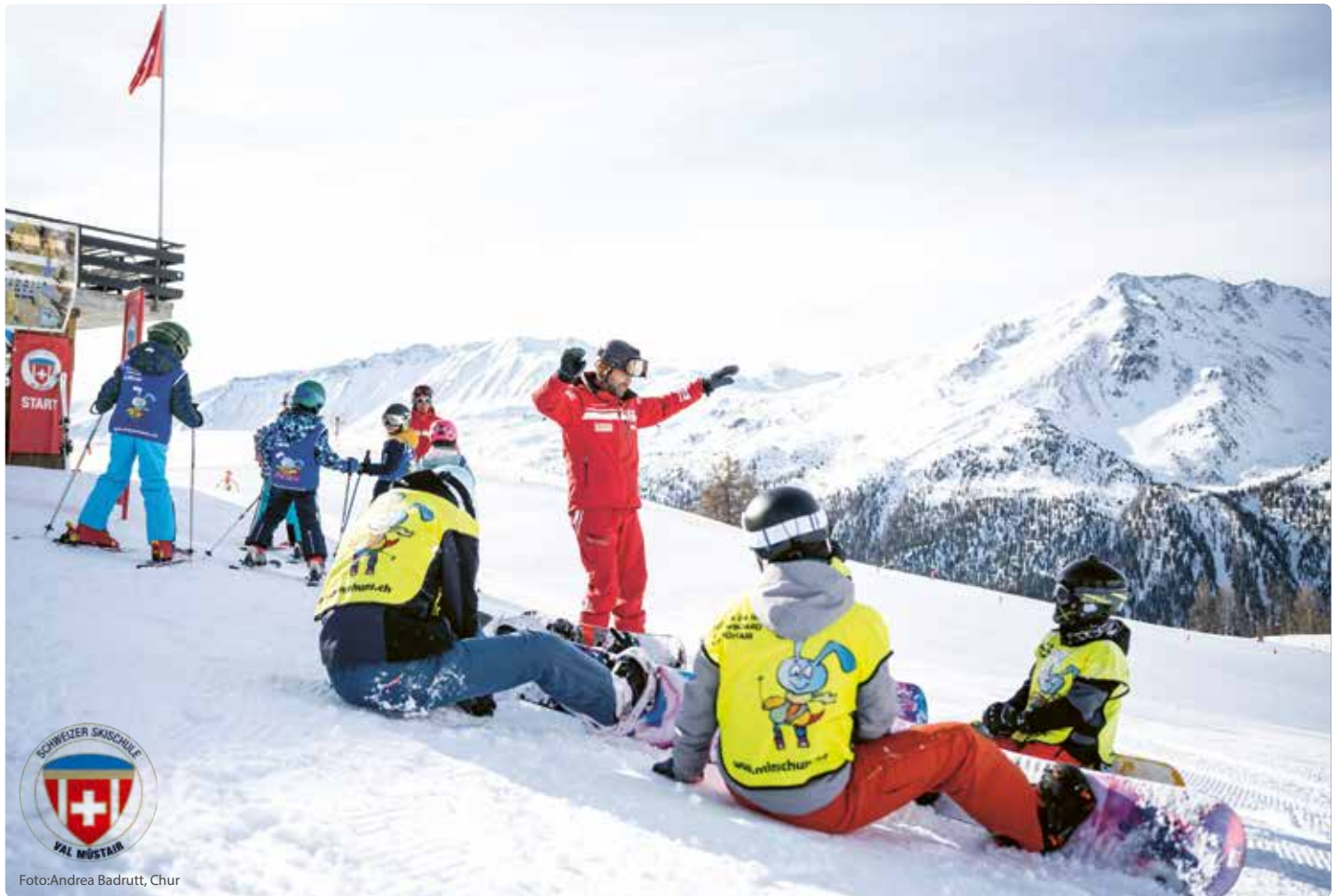
... Einheimische Skilehrerinnen und Snowboardlehrer führen Kinder gekonnt zur Freude am Schneesport ein ...